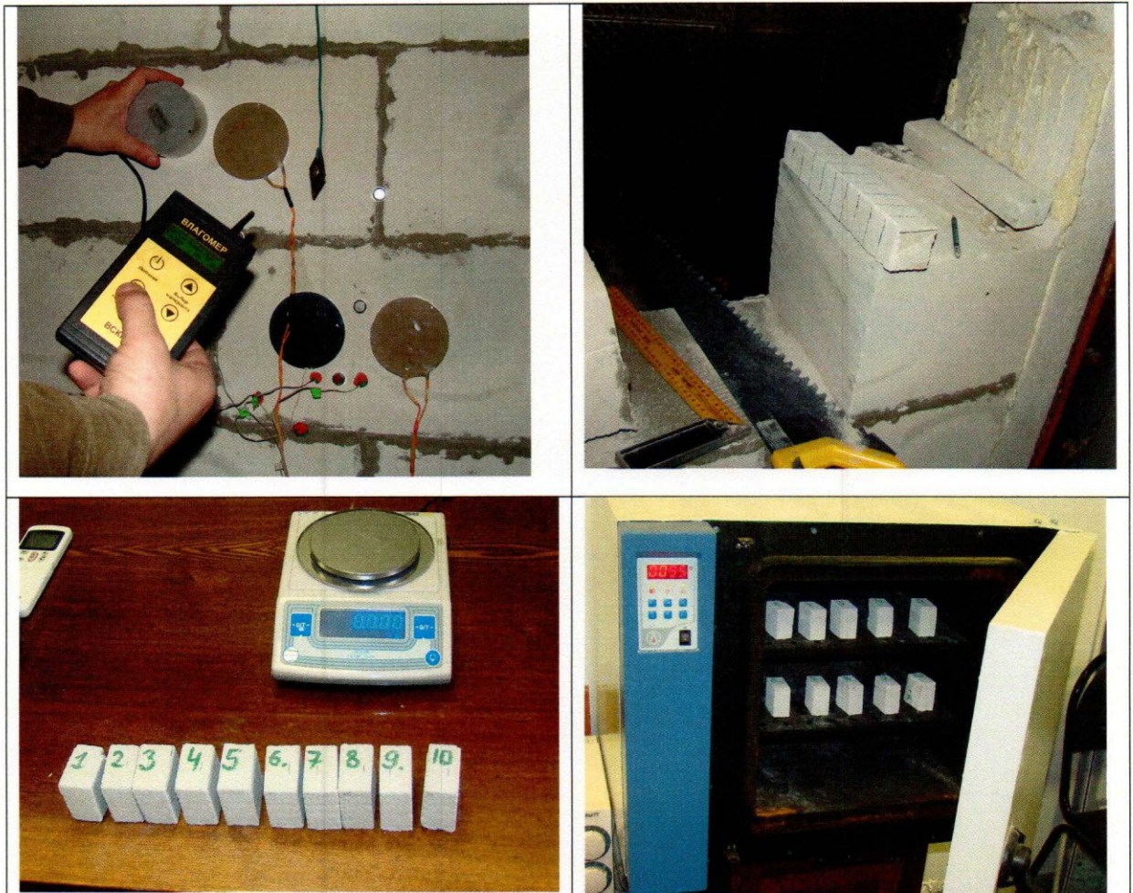
Рис. 4. Контроль влажности кладки в процессе эксперимента осуществляли посредством прибора ВСКМ-12У. По окончании эксперимента, провели отбор проб материала по толщине конструкции для определения средней влажности кладки.

Коэффициент теплопроводности кладки в сухом состоянии \lambda_0 , Вт/(м °С), вычисляли по формуле \lambda_0 = \lambda_3 - w \Delta\lambda_3 .