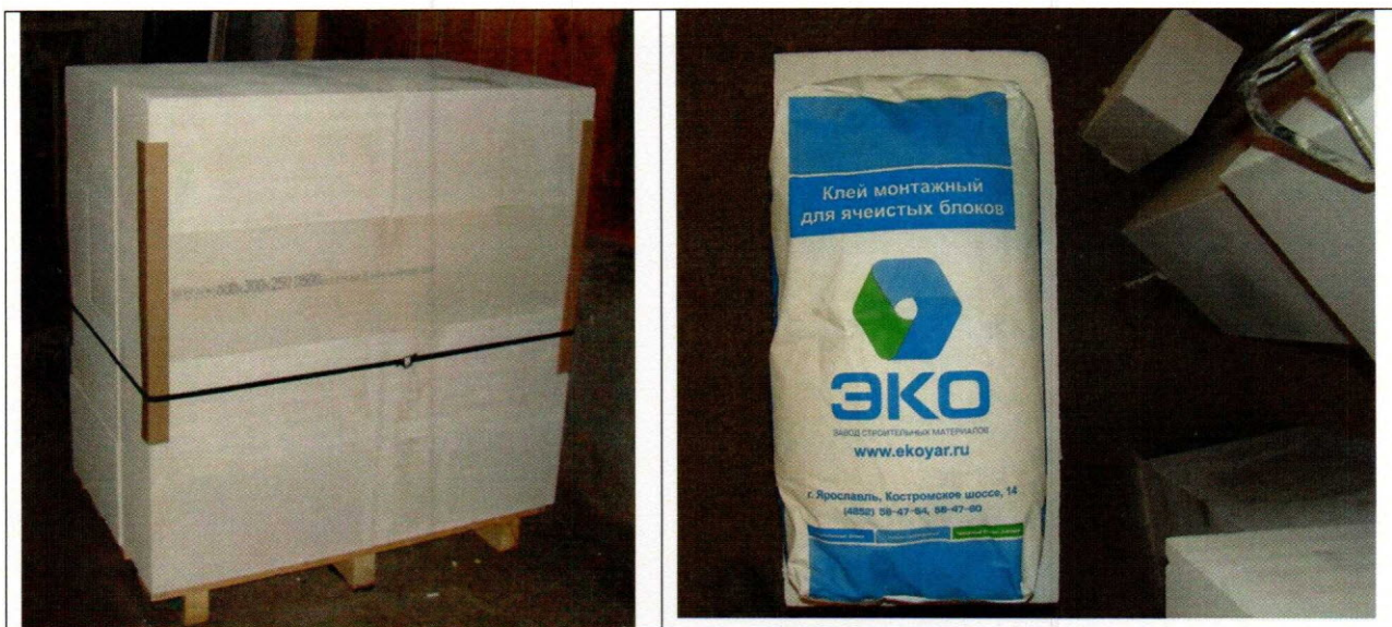
Рис. 1. Образцы блоков стеновых неармированных из ячеистого бетона автоклавного твердения БСМІ600*250*300D500В2,5F75 ГОСТ 31360-2007, а так же клей монтажный, представленные для проведения экспериментальных определений теплопроводности в кладке.

В соответствии с Техническим заданием для проведения исследований представлены блоки стеновые неармированные из ячеистого бетона автоклавного твердения БСМІ600*250*300D500В2,5F75 ГОСТ 31360-2007, номинальными размерами 600х300х250 мм в количестве 24 шт., а так же клей монтажный для ячеистых блоков, один мешок массой 25 кг. Маркировка образцов приведена по материалам, представленным ООО «ЭКО».